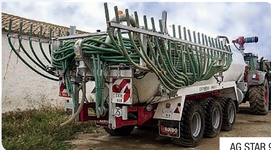
AG STAR 9