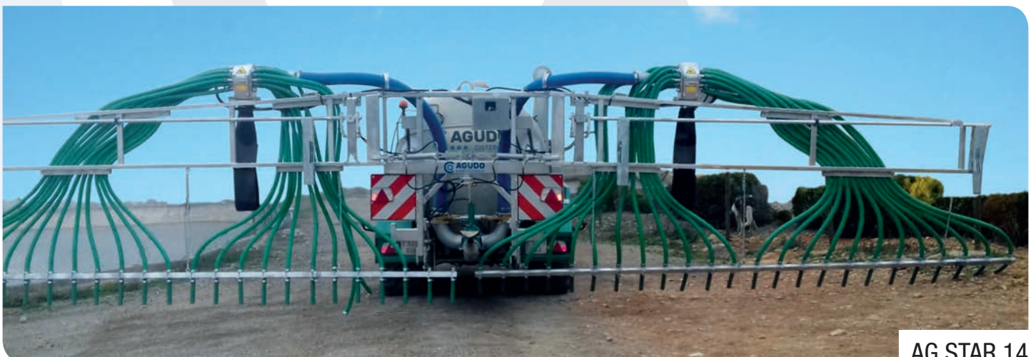
AG STAR 14